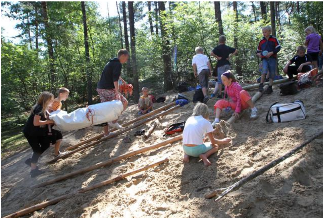
Vakantiespel Ooststellingwerf in 2010

Later organiseerden andere clubs ook dit soort kampen met loffelijke idealen. Elke zuil zijn eigen cluppie, lijkt het. Beroemd was de socialistische Arbeiders Jeugd Centrale. Die AJC bestaat niet meer, de kampen op de Veluwe zijn er nog wel, gratis voor kinderen of kleinkinderen van FNV-leden. Deze zomer zit het alweer vol.